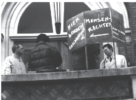
Dwaze Vaders regio Oost in actie voor de recht-bank Zutphen in 1994

In 1981 nam de Tweede Kamer een wetsvoorstel aan waarin kind en ouder wederzijdse bevoegdheid tot omgang kregen. Minister De Ruiter repte over de ‘...alles of niets constructie waardoor de ene ouder alles en de andere ouder niets krijgt’. Hij kondigde toen aan dat de ‘tirannie’ van deze constructie zou worden afgeschaft. Maar zelfs tegen deze beperkte wetswijziging rees georganiseerd verzet vanuit de vrouwenbeweging, die een demonstratie op touw zette waarmee het wetsvoorstel voor lange tijd door de Eerste Kamer werd opgehouden en uiteindelijk in 1985 werd afgeblazen. Pas in 1990 werd het recht op omgang vastgelegd, maar op inmiddels zeer beperkte condities, waarbij vooral de ‘zwaarwegende belangen van het kind’ een makkelijk middel bleken om omgang af te wijzen. Het formeel afgeschafte haalbaarheidsprincipe bleef zo in de praktijk toch in stand.