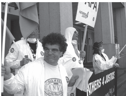
Het beeld van de actievoerende leden van F4J.

Na de zaak Petertje Hoytink bestond de verwachting dat Kinderbescherming en Jeugdzorg iets geleerd zouden hebben. Toen in 2002 op diverse plaatsen in Nederland, waaronder het strand van Nulde, lichaamsdelen werden gevonden van een meisje, bleek echter dat de overheid vooral had geleerd de mogelijke rol van de vader nog verder buiten beschouwing te laten. Uiteindelijk bleek ook dit keer dat de vader herhaaldelijk had geprobeerd het meisje te redden. In de zaak van het omgebrachte meisje Savanna, die in 2004 speelde, is tot nu toe de rol van de vader zo goed als niet aan de orde geweest. In augustus 2005 volgde de zaak Tolbert, waar een nieuwe partner van een moeder twee kinderen doodde. Ook hier had de vader meermalen bij diverse instanties aan de bel getrokken. De vaderbeweging zelf kreeg een nieuw en zeer activistisch elan met de oprichting van de Nederlandse tak van Fathers4 Justice.