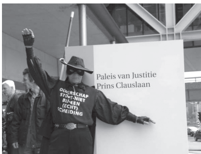
Zorro van een andere organisatie